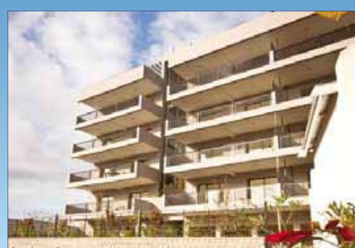
Immeuble Atlantis Ilafy