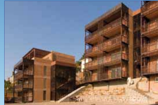
Résidence Fort Voyron