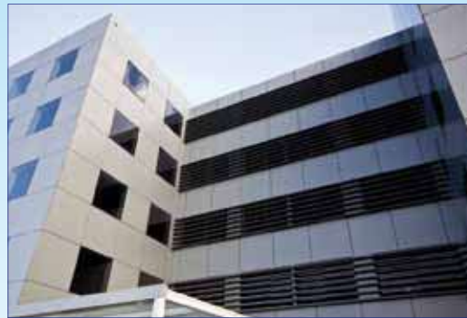
Immeuble de bureaux RN2 Bis Toamasina