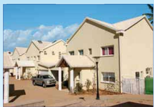
Résidence "Clos Sammanah" Ambatobe